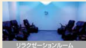
リラクゼーションルーム